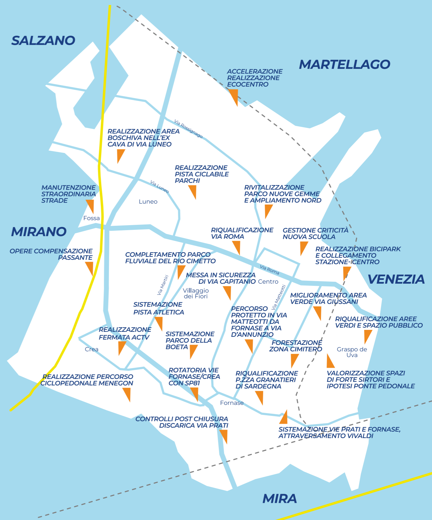
ALCUNE CRITICITÀ DEL COMUNE DI SPINEA OGGETTO DEL NOSTRO PROGRAMMA